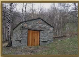
Moulin des Plans au Col