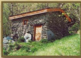
Moulin du Villeret