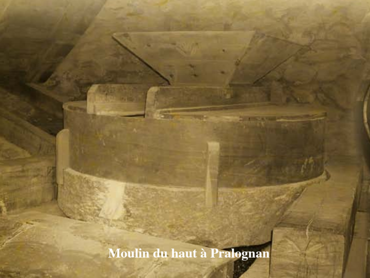
Moulin du haut à Pralognan

LE MUSEE : Objets et outils traditionnels, un voyage dans le monde d'autrefois.