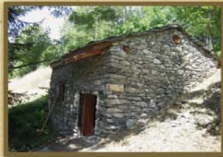
Moulin du Soliet

A SAINT-ANDRE , le ruisseau des Moulins et celui de la Scie, entraînaient, moulins à grains, scies battantes, martinet, forges et clouterie. En 1878, on comptait vingt moulins. Ils cessèrent toute activité vers 1970. Celui de Pralognan date de 1798.