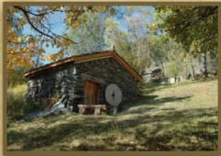
Moulin du Bas à Pralognan